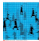
Indicateurs du marché du travail 2008

« Indicateurs du marché du travail, 2008 », enquête publiée par l'Office fédéral de la statistique, offre une vue d'ensemble du marché suisse du travail. Parmi